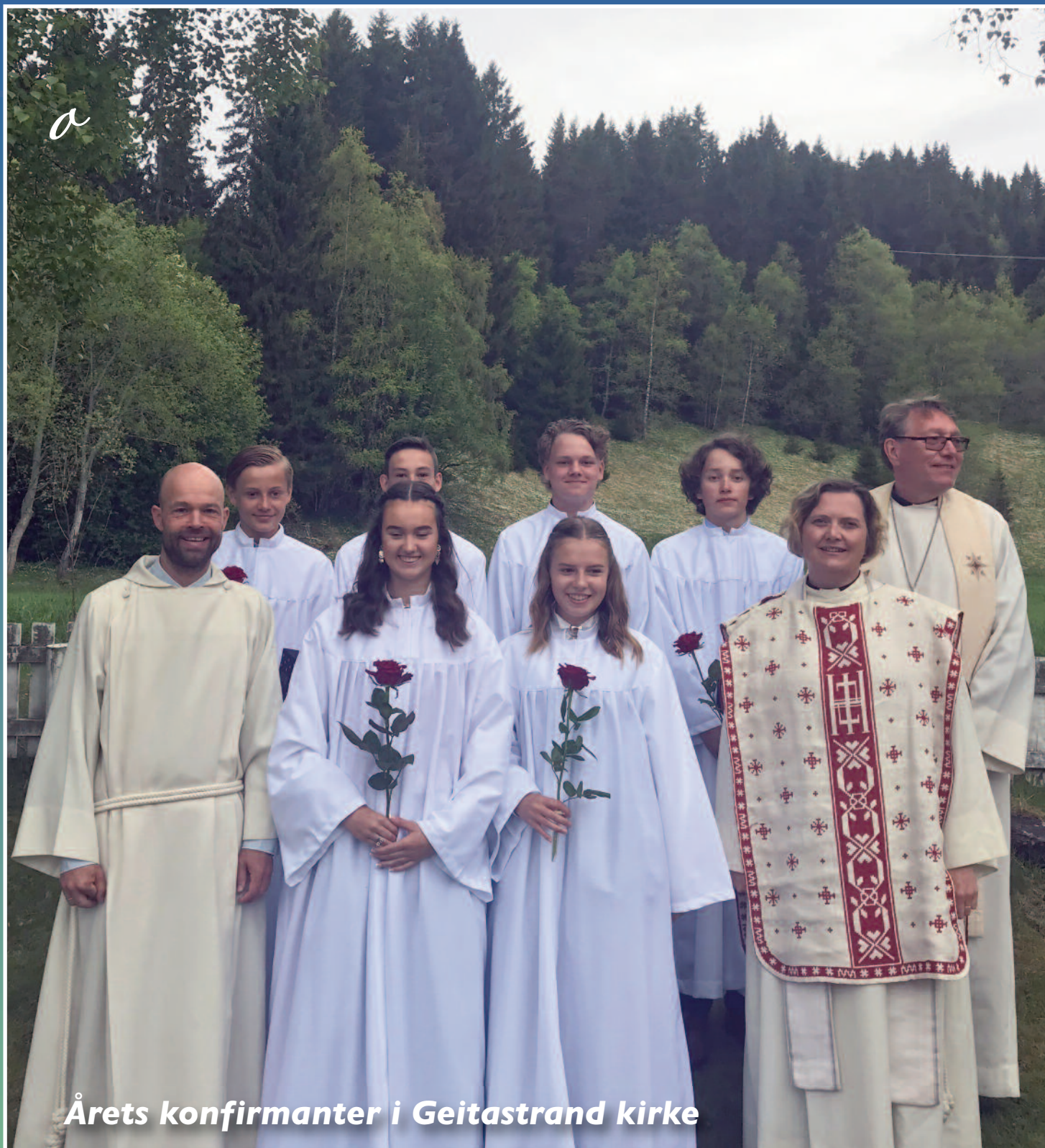
Årets konfirmanter i Geitastrand kirke