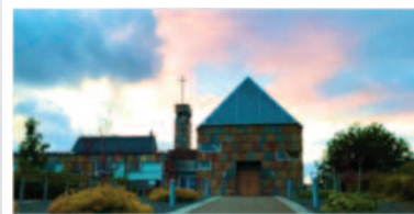
Maria-klosteret på Tautra.

Mer informasjon blir lagt ut på kirken.no/orkdal etter hvert. Eller ta kontakt med Orkdal kirkekontor, tlf. 72479750.